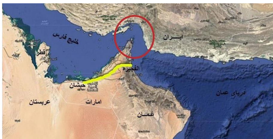
شکل ۱ موقعیت تنگه هرمز

تنگه هرمز به دلیل موقعیت حساس ژئوپلیتیک و استراتژیکی خود، خود به عنوان معبری حیاتی و تاثیرگذار برای حفظ نظام و میهن ما می باشد و چنانچه خدشه ای بر آن وارد گردد و یا تمامیت ارضی آن مورد هجوم قرار بگیرد، امنیت ملی که یکی از ارکان اساسی و پایه ای برای کشور است با خطر مواجه می گردد؛