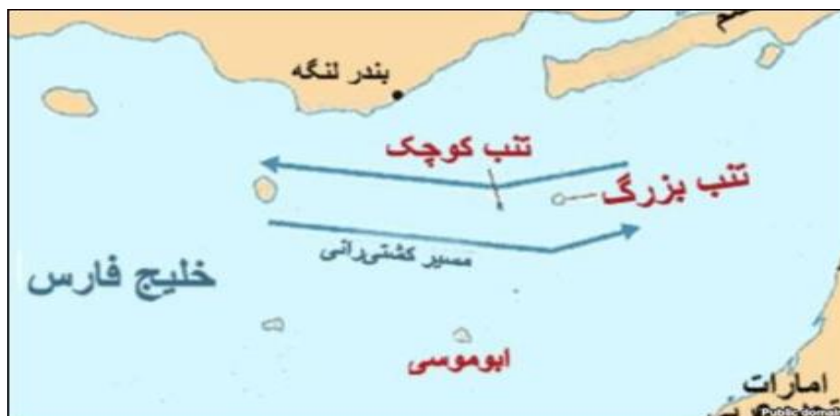
شکل ۱ - موقعیت استراتژیک جزایر سه‌گانه در خلیج فارس (منبع: کیانی، ۱۳۹۶)

جزیره در خط الراس عبور کشتی‌های باری و نفتکش منطقه واقع شده است اهمیت زیادی به خود اختصاص داده است (نقشه (۱).