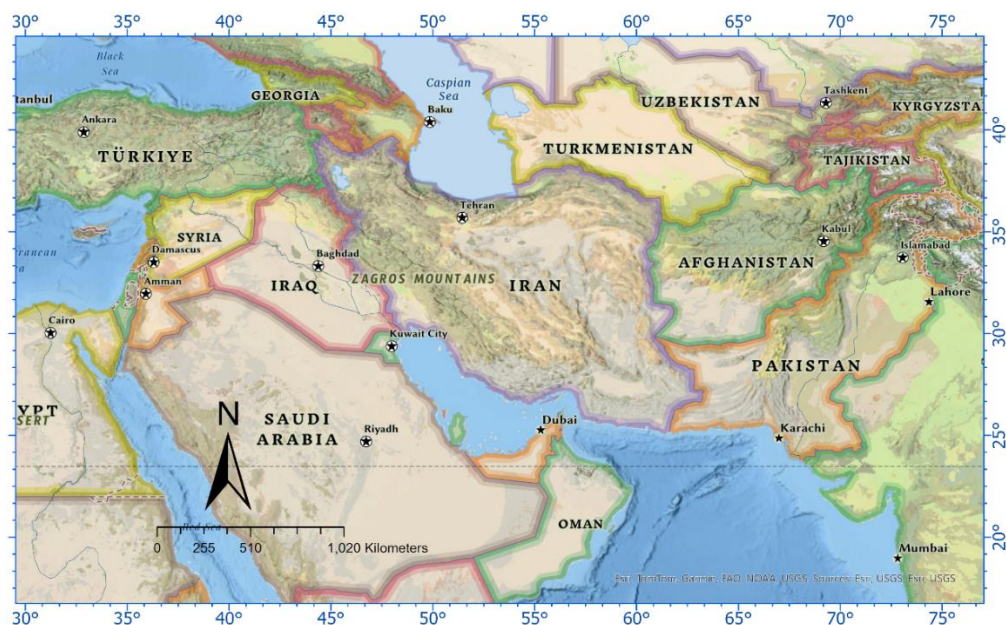
شکل (۲): موقعیت نسبی ایران در منطقه

جزیره ای صخره ای با وسعت ۱,۵ کیلومتر مربع جنوب شرق خلیج فارس قرار دارد. از نظر تقسیمات کشوری جزء بخش تنب از شهرستان ابوموسی است. این جزیره از شمال غرب در فاصله ی ۴۲ کیلومتری بندر لنگه از شرق در فاصله ی ۱۳ کیلومتری جزیره تنب بزرگ از جنوب غرب در فاصله ی ۳۹ کیلومتری جزیره ابوموسی و از غرب به جزیره فارور محدود است. فاصله ی این جزیره تا عمارات، راس الخیمه ۹۲ کیلومتر می باشد. به علت فقدان آب آشامیدنی و بعضی شرایط خالی از سکنه است (شکل ۲).