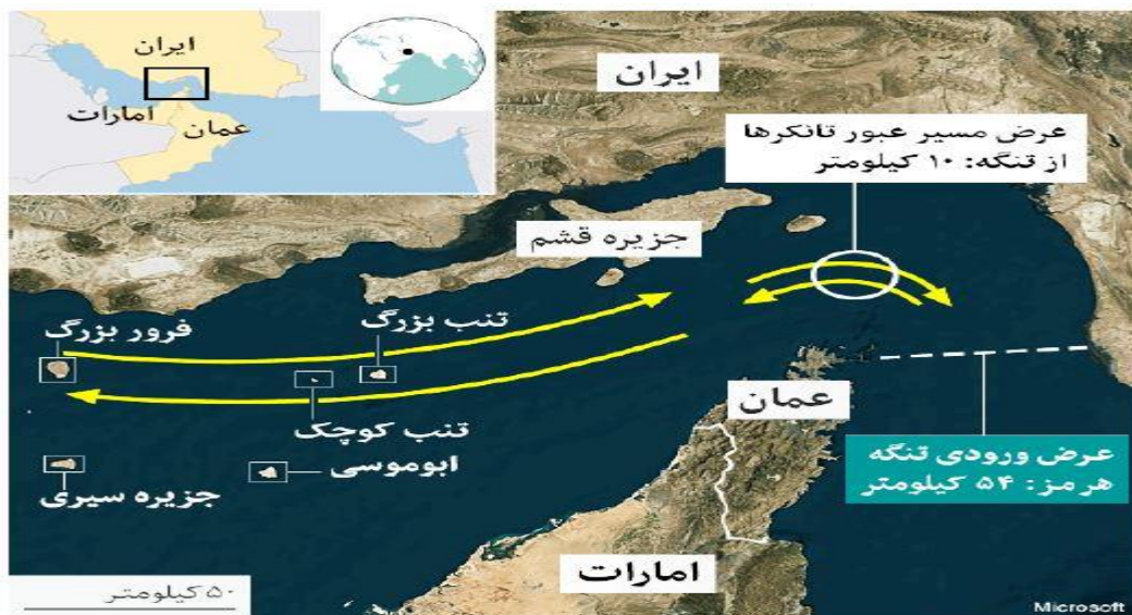
شکل (۱): نقشه جایگاه جزایر سه گانه

جزیره بوموسی بین ۰۱,۵۵ و ۰۴,۵۵ درجه طول شرقی و ۵۱,۲۵ درجه عرض شمالی و در ۵۰ کیلومتری خاور جزیره سیری قرار دارد. همچنین جزیره تنب بزرگ بین ۱۶,۵۵ و ۱۹,۵۵ درجه طول شرقی و ۱۵,۲۶ و ۱۹,۲۶ درجه عرض شمالی و در حدود ۳۱ کیلومتری جنوب باختری جزیره قشم قرار دارد. جزیره تنب کوچک در ۸,۵۵ و ۹,۵۵ درجه طول شرقی و ۱۴,۲۶ و ۱۵,۲۶ درجه عرض شمالی در ۱۲ کیلومتری تنب بزرگ قرار دارد و فاصله آن از بندرلنگه، ۴۵ کیلومتر و از رأس الخیمه ۸۰ کیلومتری است (جالینوسی، ۱۳۸۶: ۴۹۹).