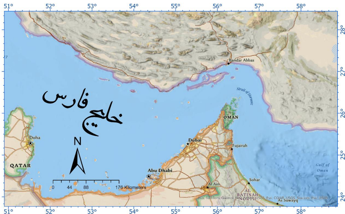
شکل (۳): نقشه موقعیت خلیج فارس